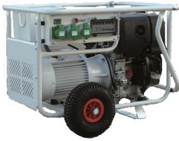
Moteur diesel HATZ 1B30 ou 1B40 Silent / 97 dB