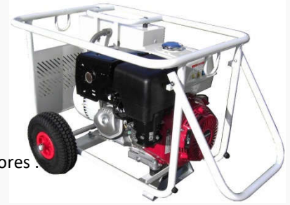
Moteur essence HONDA GX390 – 96 dB

Puissance électrique : 3,8 à 5,5 kva Sorties : 2 x 115V + 1 x 42 V Protection : IP 44 Protection électrique : 3 mA Conformes SANS capotage à la Directive 2000/14/CE sur les nuisances sonores