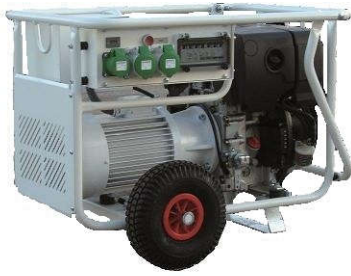
Moteur diesel HATZ 1B30 ou 1B40 Silent / 97 dB